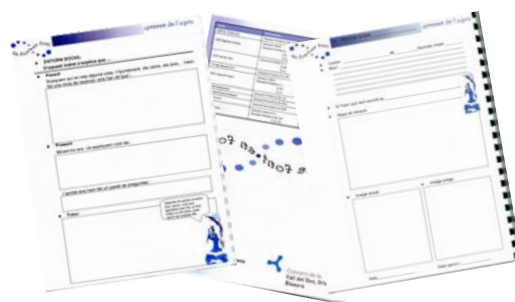
Imatge 2: Guies didàctiques utilitzades.

Es disposa també d'un dossier complementari que ajuda a completar i ampliar informació.